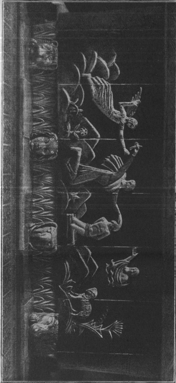
Das Opfer Abrahams auf dem Antependium des Hochaltars

tragen wird, die Anhänglichkeit der Gemeinde an St. Michael zu stärken.