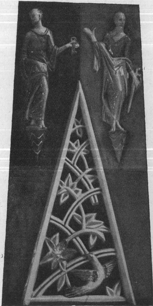
Apostelbilder am Hochaltar