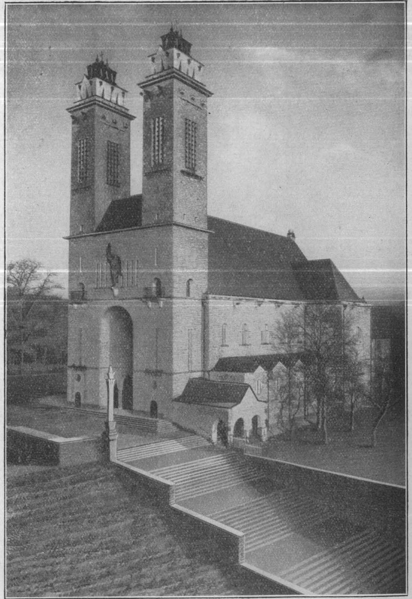
DIE KIRCHE ST. MICHAEL