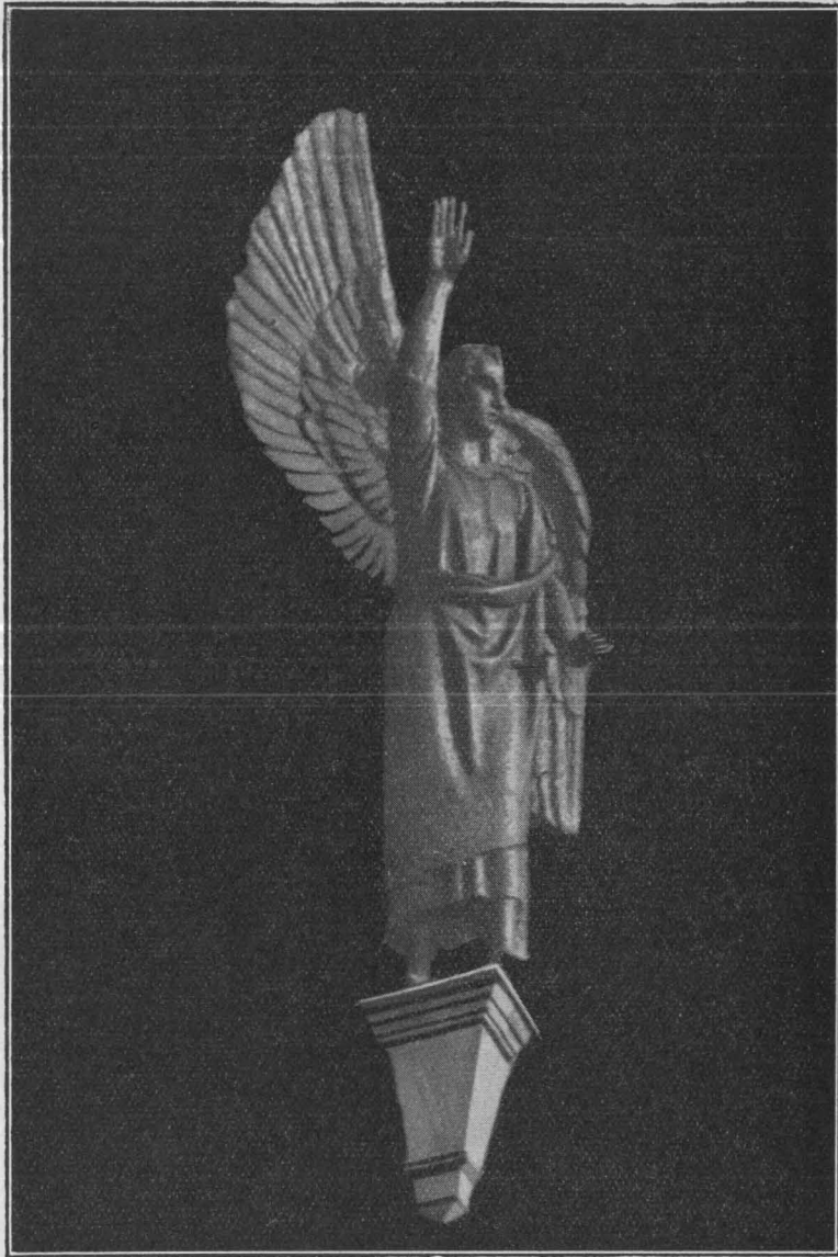
Das Portalbild des hl. Michael

Bronzeguß der Firma Brandstetter, München. Künstlerische Ausführung des Herrn Franz Lorch, Bildhauer, München. Geschenk des Kath. Kaufmännischen Vereins Saarbrücken